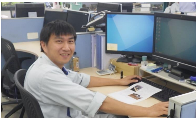
(H26採用 工務第二課所属)

学校を卒業後、工事施工会社に勤務していましたが、休日が少なく、自分の時間や家族との時間がなかなか取れず悩んでいたところ、センターのことを知りました。センターの業務は、施工経験を活かせる仕事が多いことも知り、試験を受け、無事入社できました。