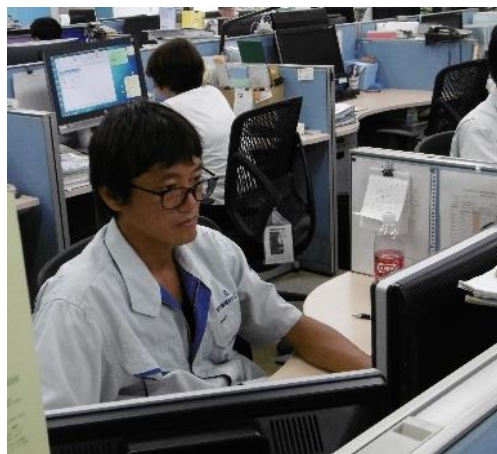
(H25採用 事業推進課所属)

私の属する事業推進課では、公共土木工事積算システムの提供のほか、道路施設維持管理に係る施設点検、システム提供、長寿命化計画の策定など、多岐にわたる業務を担当しており、私もそれらの業務に他の職員と協力しながら携わっています。ユーザーの皆様の意見を聞き、システム等の改善や的確な成果が出せるよう励んでいます。