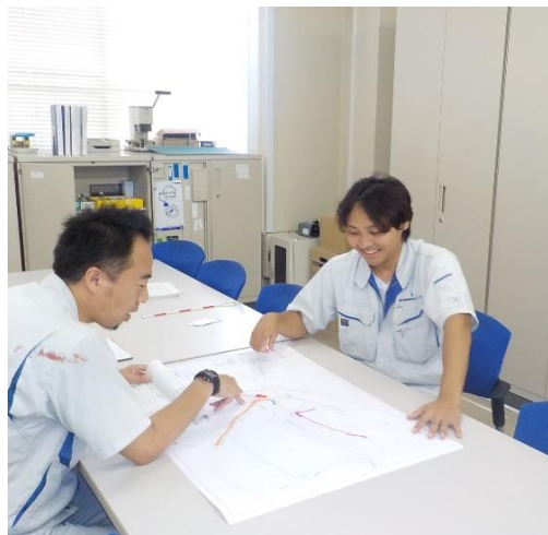
(H29採用 支所第一課所属)

私は、高校生の時から、道路・橋梁の建設に係る仕事をしたいと思っていました。そのため、土木工学を学ぶために大学に通いました。卒業後は、建設会社に入社し、現場監督をしていましたが、働いている内にもっと土木工事の計画から携わりたいと思い、転職を決めました。その際、お世話になっていた先輩との会話から技術センターを知り、学んできた知識を活かせると思い入社しました。